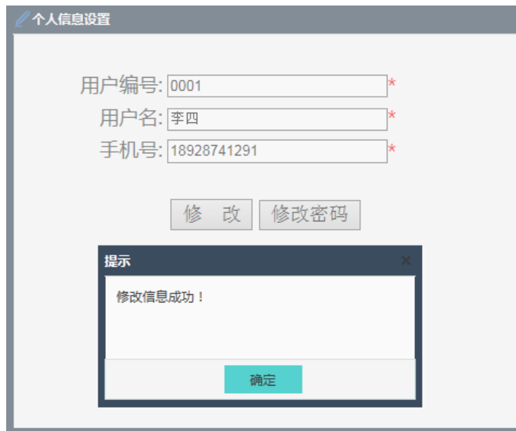
图 2.2.2-1 个人信息修改页面