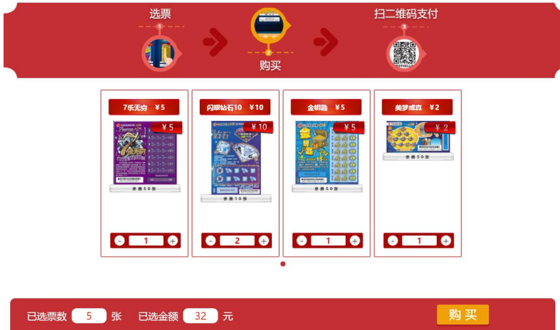
图 2.1.3.1-1 选号页面

6) 点击任一票种图样，应弹出该票种的“票面须知”，如图 2.1.3.1-2 所示。