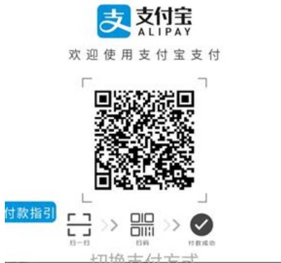
图 2.1.3.2-3 支付宝二维码生成页面