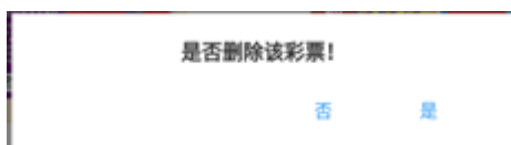
图 2.1.2.2.1.2-1 删除彩票页面