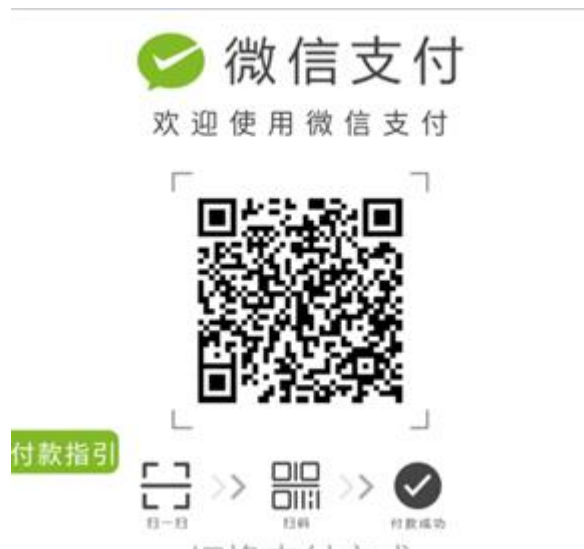
图 2.1.3.2-2 微信二维码生成页面