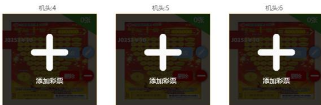
图 2.1.2.2.1.1-1 添加彩票