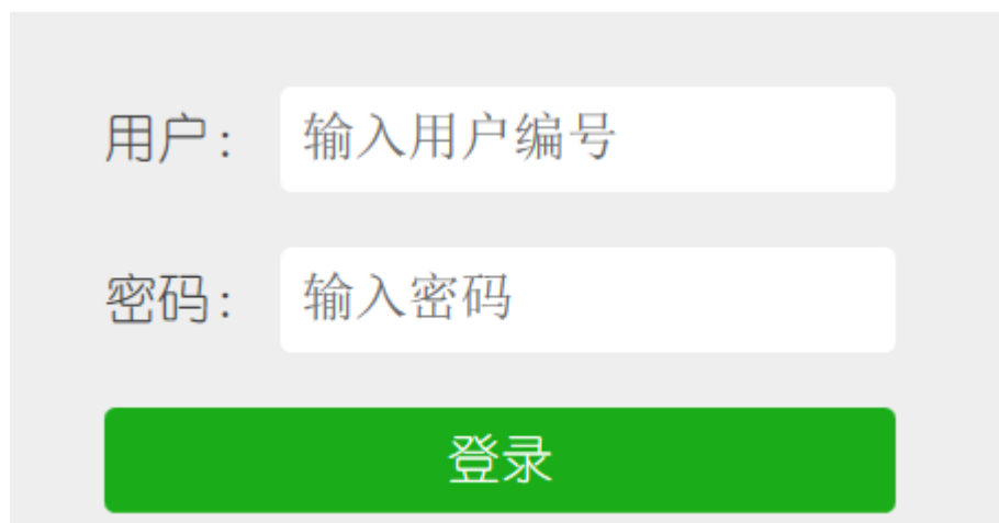
图 2.2.1-1 业主登录页面