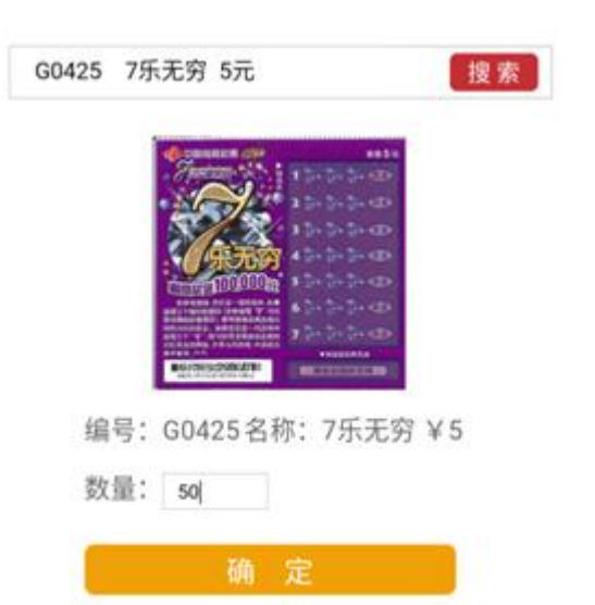
图 2.1.2.2.1.3-1 票种数量修改