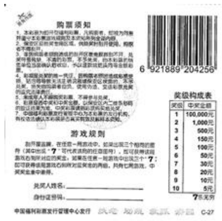
图 2.1.3.1-2 票面须知

6) 点击任一票种图样，应弹出该票种的“票面须知”，如图 2.1.3.1-2 所示。